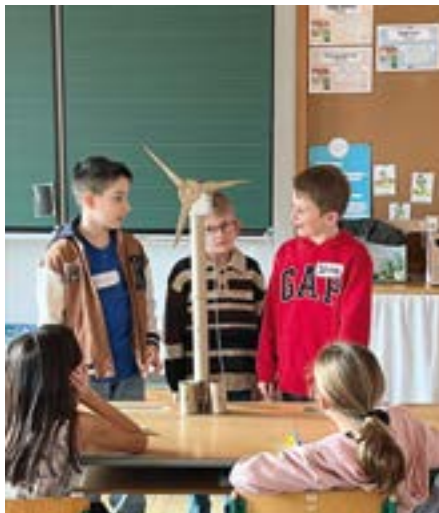
Eine Erfindung aus gesammeltem Müll.

An diesem ganz besonderen Projekt durften die Kinder der 3. Klasse am Donnerstag, den 5. Februar mitarbeiten. Gemeinsam mit ein paar HAK Schülern und Schülerinnen aus Oberndorf erforschten sie die Probleme rund um das Klima und versuchten durch konkrete Ideen diese zu lösen. Die Stimmung in den Klassen war sehr gut – Kreativität, Freude, Engagement, Teamgeist und Stolz lagen in der Luft.