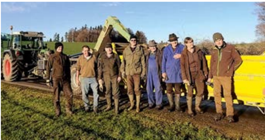
Landwirte und Jägerschaft entfernten gemeinsam hunderte Meter Wildschutzzäune in den Jungwäldern.

Landwirtschaft und Jägerschaft gemeinsam viele hundert Meter alter Wildschutzzäune abgebaut, die ihren Zweck für die Jungwälder bereits erfüllt hatten. Durch diese Maßnahmen schaffen wir wieder barrierefreie Wege für unsere Wildtiere und Raum zur Entfaltung für einen gesunden Wald.