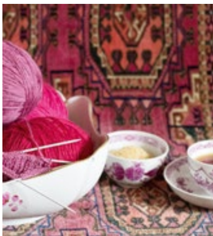
Handarbeitsrunde jeden zweiten Dienstag im Pfarrheim

Ein Essen kostet € 7,30 inkl. Zustellung. Kontakt: Elfriede 0664 1440269