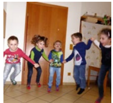
Die Kinder beim Englisch-Kurs

Bei Interesse melden (der genaue Tag wird noch festgelegt) bei Birgit Fuss, birgit.fuss@sbg.at, 0650 65 77 617.