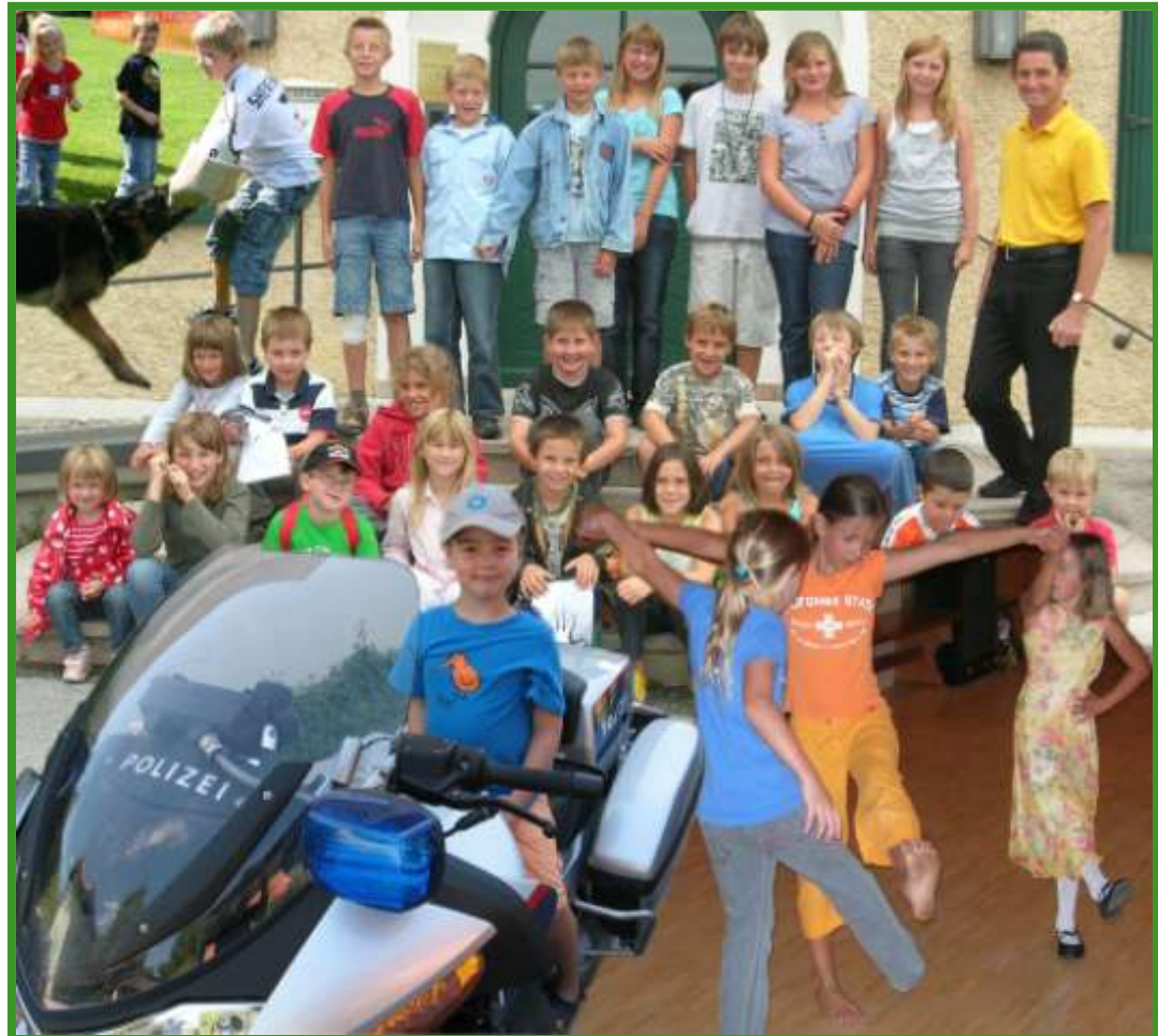
Vereinswoche ein voller Erfolg!