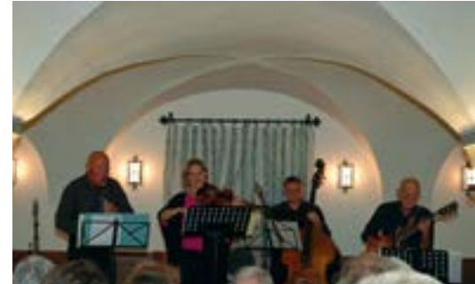
Jazzdoc & Friends eröffneten das Wochenende am Freitag.

Karten: Online unter www.kultur-anthering.at und während der Öffnungszeiten in der Trafik Anthering.