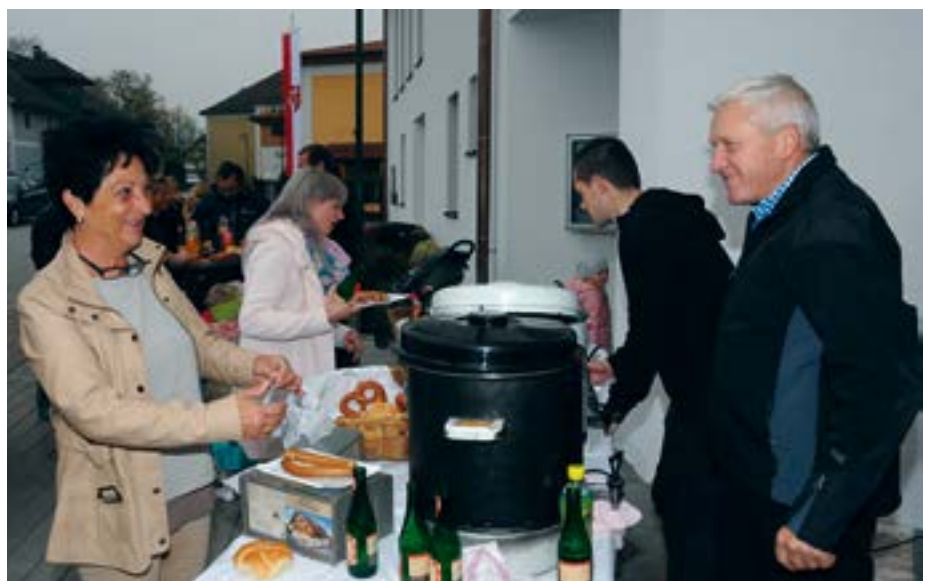
Das „Kernei-Team“ versorgte die Besucher mit Würstel und Getränken.