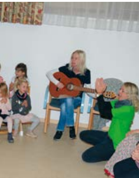
mit einem eigens für die Eröffnung

Mit diesen Baumaßnahmen wurde ein großes Ausbauprojekt abgeschlossen und ich gehe davon aus, dass wir mit den vorhandenen Räumlichkeiten mittelfristig für die kommenden Anforderungen bestens gerüstet sind.