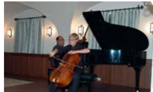
Der neue Flügel kam am Samstag das erste Mal zum Einsatz.