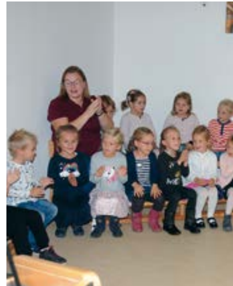
Die Kinder der Gruppe 5 begeisterten komponierten Lied.