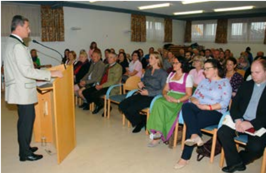
Der Bürgermeister eröffnete den neuen Kindertenteil im voll besetzten Kulturraum.