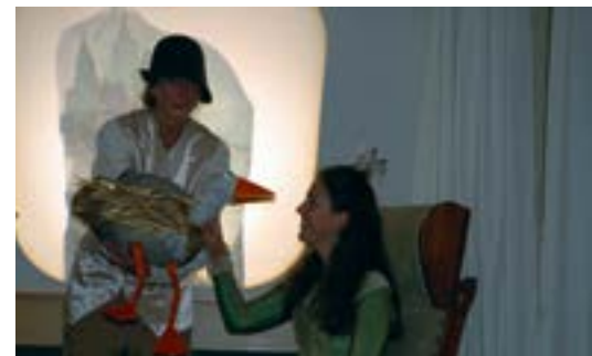
Beim Märchennachmittag der Gruppe Märchenklang am Sonntag hatte die Goldenen Gans ihren großen Auftritt.