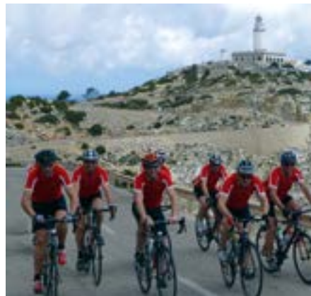
Die Sektion Radsport startet gemeinsam in die neue Saison.

Wer nicht mehr gerne alleine sondern in der Gruppe mit dem Rennrad fährt ist herzlich willkommen. Abfahrt ist immer beim Sportheim und alle begeisterten Radler sind gerne gesehen. Einfach einmal mitfahren und wenn es Spaß macht immer wieder kommen!