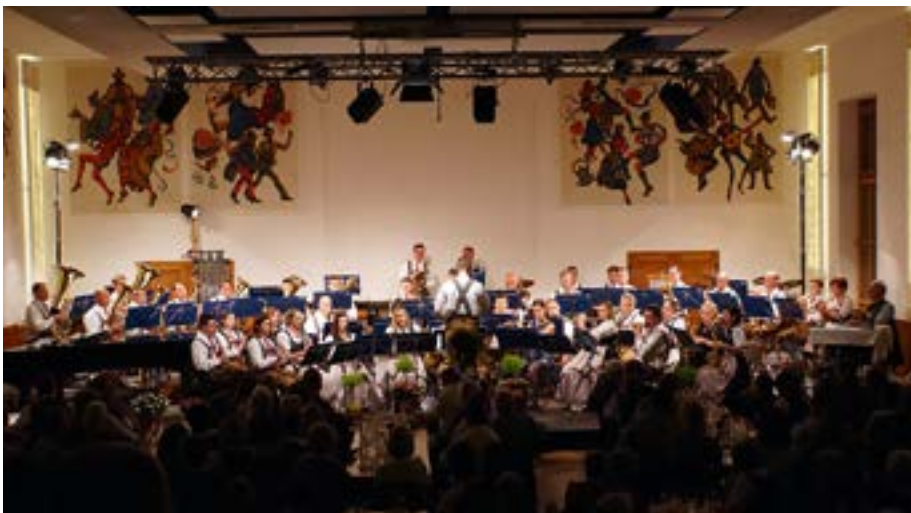
Unsere Musiker beim Frühjahrskonzert 2017.