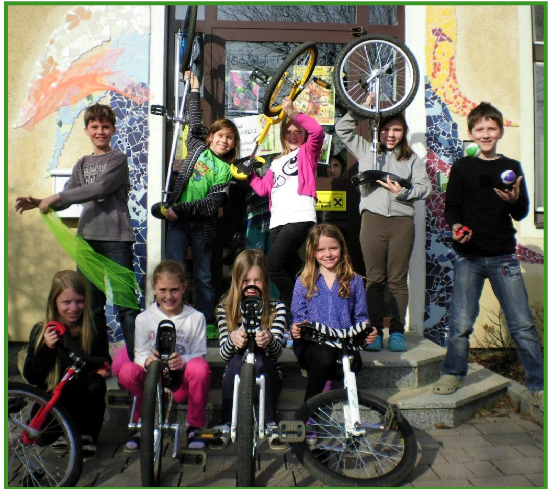
Circus im Dorf am 1. Juni 2012