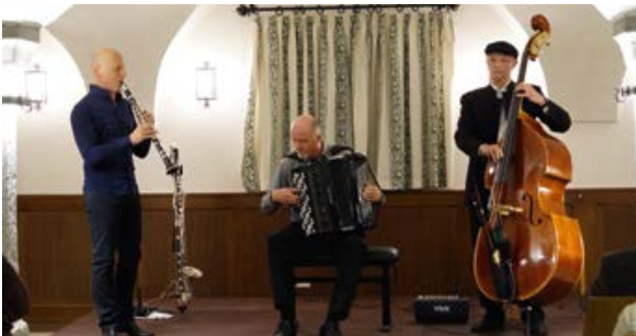
Die Klezmer-Connection sorgte im April für einen ausverkauften Ross-Stall.