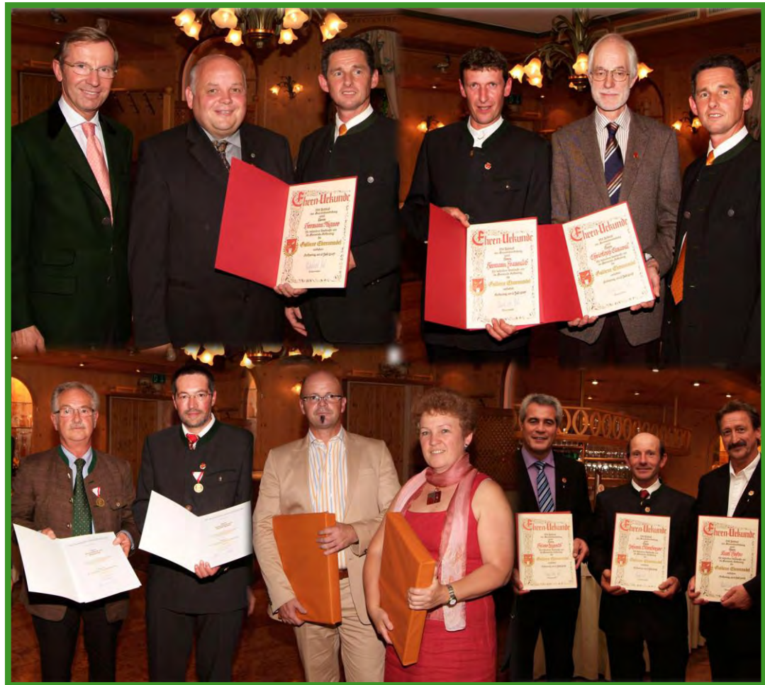
Ehrungsfestakt Hotel Ammerhauser am 3. Juli 2009