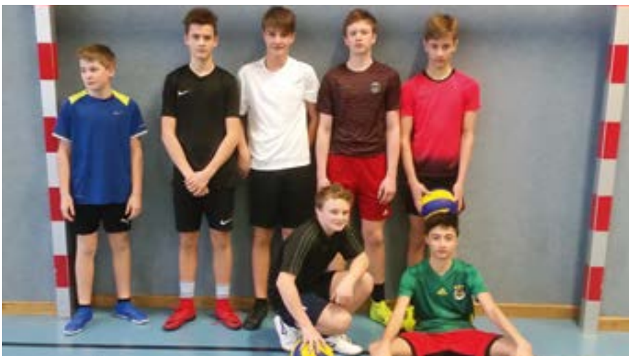
Die „Ädaringa“ der 4a gewannen gegen die „Black Panthers“ aus der 3b.

Den dritten Platz erkämpften sich die „Crazy Boys“ aus der 2b, „Leberkas“ aus der 3a wurden Vierte. Alle Teilnehmerinnen und Teilnehmer spielten konzentriert, motiviert und fair und die Stimmung im Turnsaal war toll! Die Mitschülerinnen und Mitschüler feuerten ihre Teams lautstark an und belohnten die tollen Leistungen mit kräftigem Applaus.