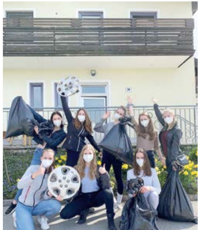
... die Landjugend sammelten Müll im Gemeindegebiet.