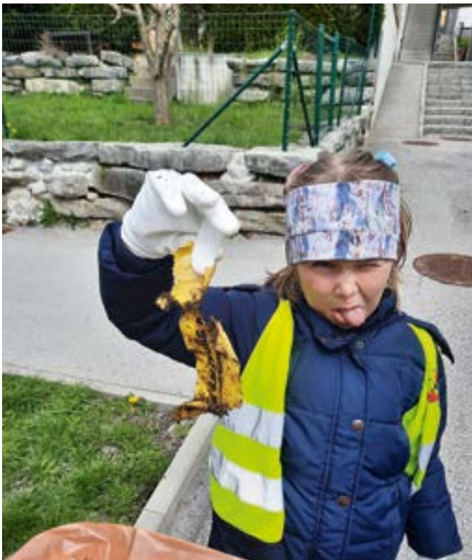
Die Volksschulkinder und ...

Unter dem Motto „Gemmas on, ramma zom“ beteiligte sich die Landjugend Anthering an der Müllsammelaktion der Landjugend Salzburg. Dafür nahmen sich acht Mädels der Ortsgruppe am 10. April Zeit und marschierten in Zweiergruppen quer durch den Ort, um den Müll einzusammeln und zu entsorgen. Die Hauptgebiete waren jedoch Lehen und die Leberersiedlung, wo unter anderem sehr viel gefunden wurde. In Zukunft sollte weniger Müll auf den Straßen und Wiesen entsorgt werden und stattdessen jeder einen Beitrag zu einer sauberen Umwelt leisten!