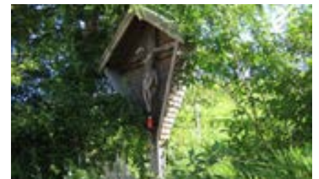
Das Wetterkreuz Adelsberg wurde 1983 zum Schutz vor Naturgewalt geschnitzt und aufgestellt.

sollen. Wer alle Stempel bei den verschiedenen Kapellen/Wegkreuzen gesammelt hat, kann den Wanderpass in eine Sammelbox in der Pfarrkirche werfen. Die Gewinner werden gezogen und im November verständigt. Es gibt schöne Preise zu gewinnen!