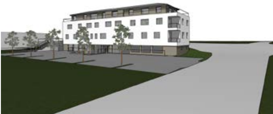
Der Entwurf des geplanten Ärztehauses für Anthering wird bei der Gemeindeversammlung der Öffentlichkeit präsentiert.

Nutzen Sie diese Gelegenheit und informieren Sie sich über das aktuelle Gemeindegeschehen direkt an der Quelle!