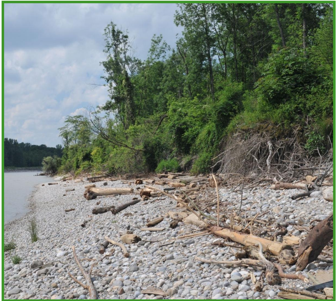
Informationsveranstaltung "Managementplan Natura 2000-Gebiet Salzachauen"