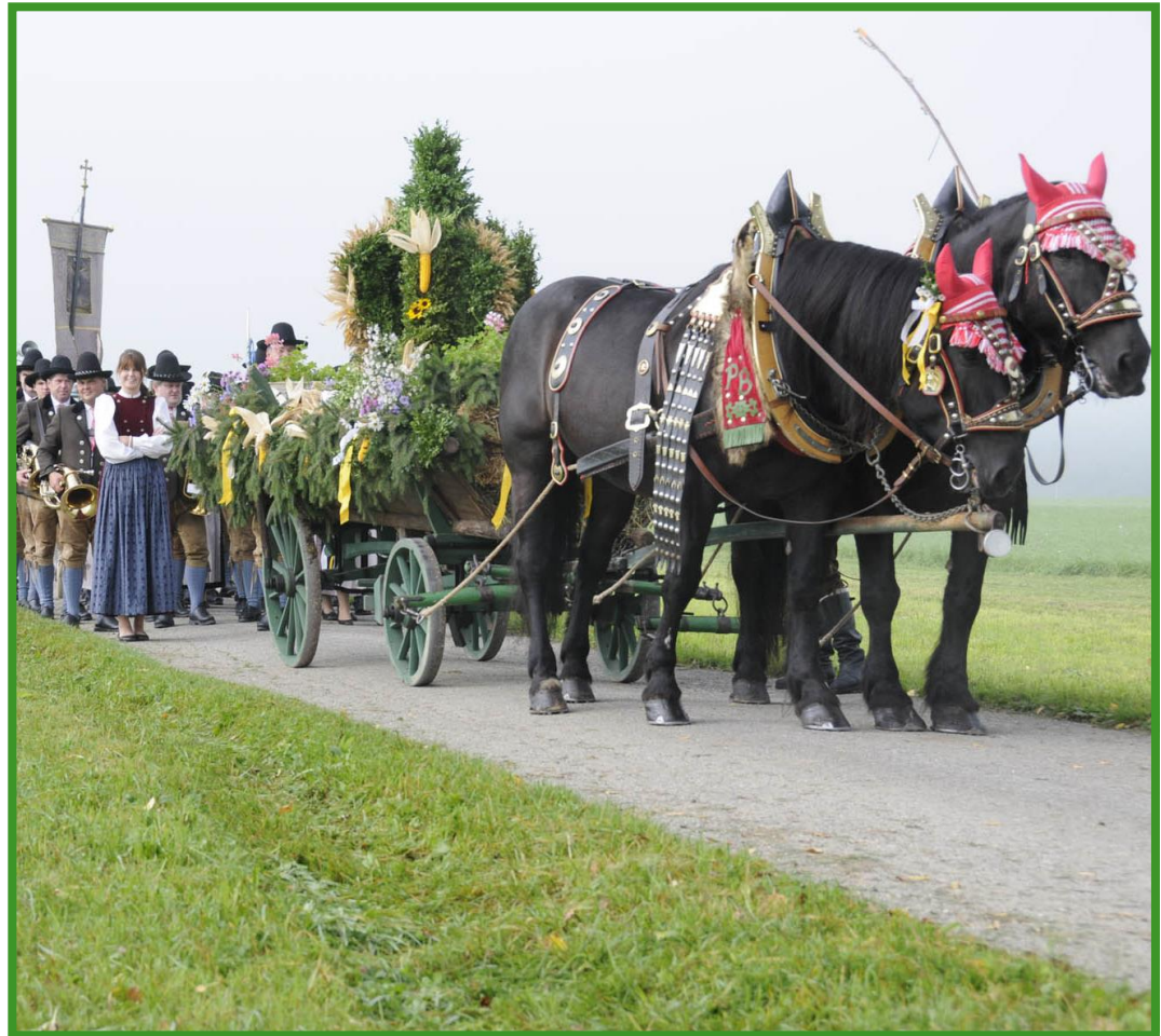
Weinfest und Erntedank am 26. und 27. September 2015