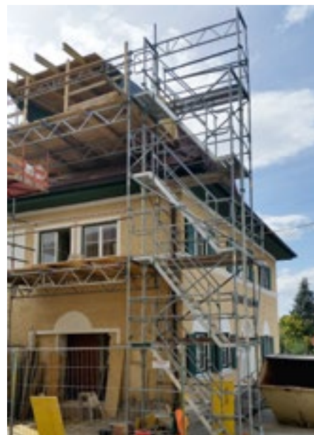
Der Umbau zum barrierefreien Gemeindeamt war eines der wichtigsten Vorhaben des außerordentlichen Haushaltes im Jahr 2015.