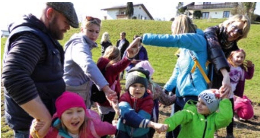
Kinder- und Familienolympiade in Anthering – Rein in Vergnügen

Freitag, 10. Juni 2016, 14.00 bis 16.30 Uhr € 15,00 pro Kind, Geschwister je € 10,00, Familien (4 Personen) € 25,00 Treffpunkt: Volksschule Anthering