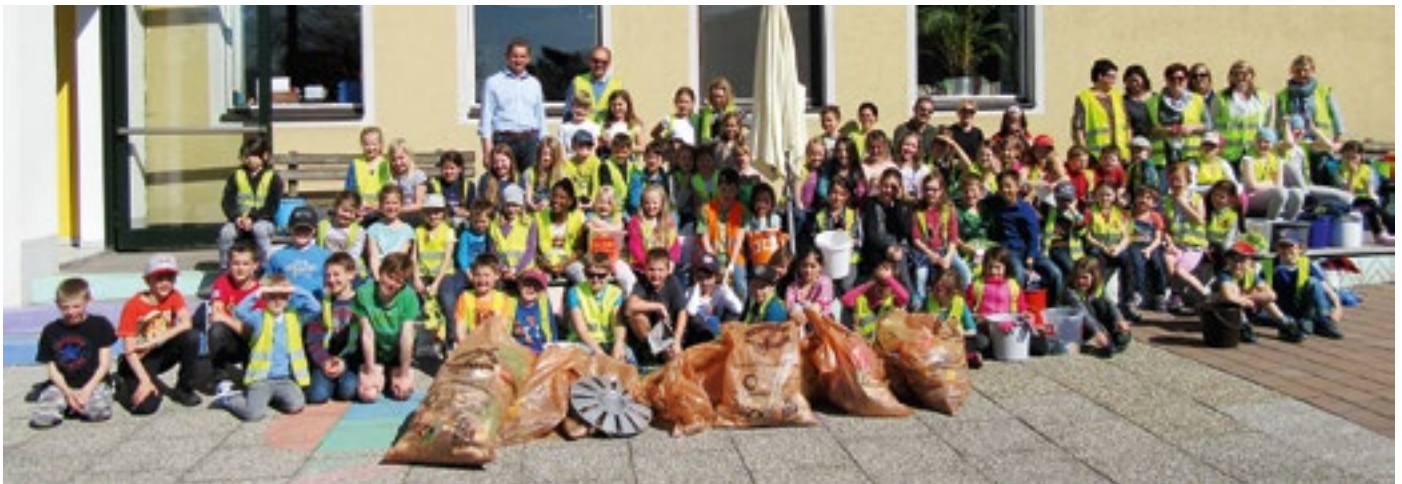
Die Volksschüler und ihre Begleitpersonen mit dem Ergebnis der Sammelaktion.