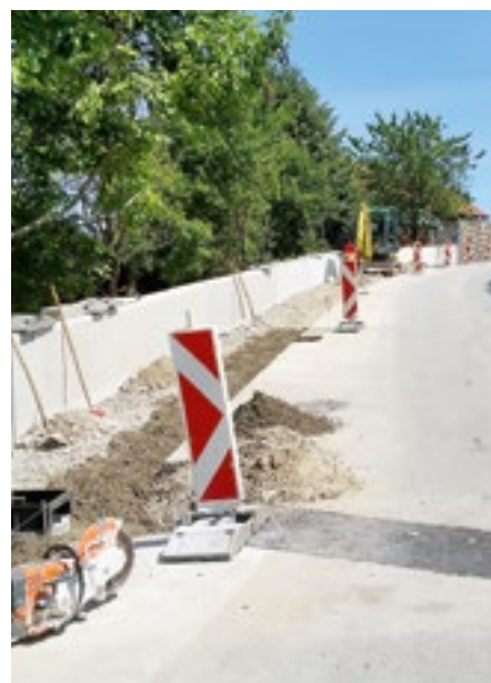
Die Verlängerung des Gehsteiges in der Bergstraße trägt zur Erhöhung der Verkehrssicherheit bei.